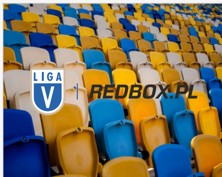
Logo na wielobarwnym tle