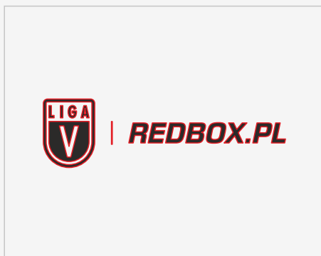
Dodawanie obrysu do znaku