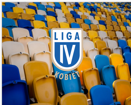
Logo na wielobarwnym tle